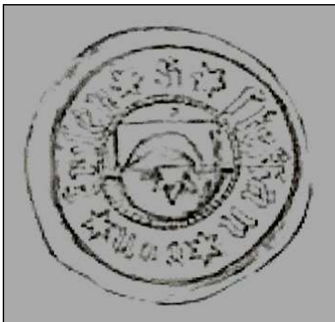
Schild mit Halbmond, zwischen dessen Hörnern eine Sonne oder ein Stern mit 8 Strahlen

Die beiden Linien haben unterschiedliche Wappen :