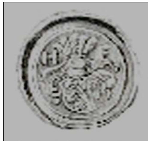
Im Schilde einen Zweig mit drei Rosen und Blättern, auf dem Helme fünf Straußfedern