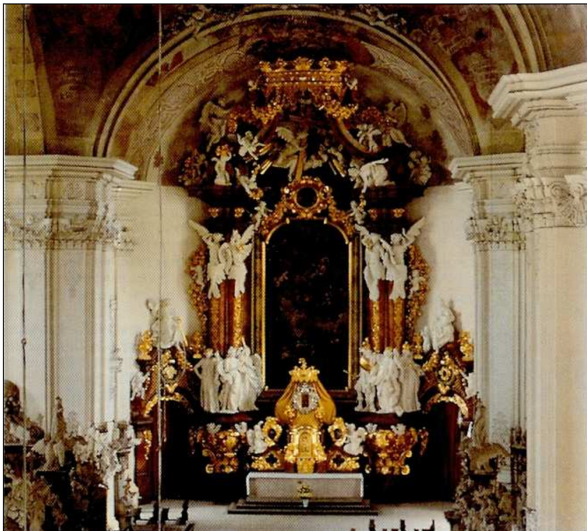
Der Hochaltar „Mariä Himmelfahrt“ mit dem Gnadenbild