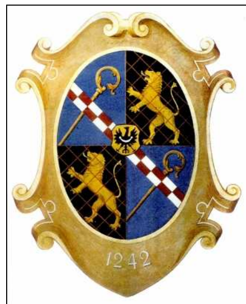
Das Wappen der Abtei Grüssau