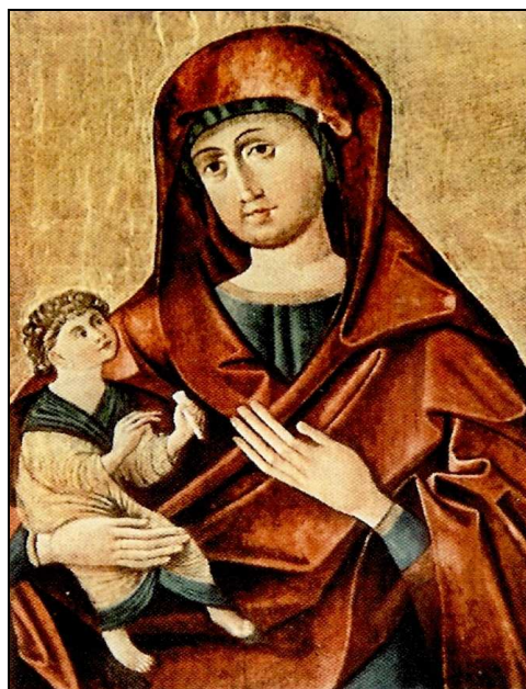
Das Gnadenbild befindet sich unter einem Baldachin, integriert in den Hochaltar.